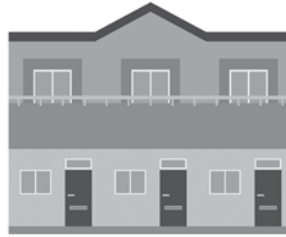
アパートなどの外構工事など

固定資産税は、土地や家屋のほか、事業で使用することができ、償却資産にも課税されます。償却資産とは、個人または法人で工場や商店などを経営し