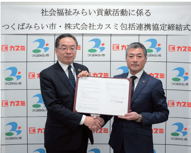
社会福祉みらい貢献活動に係る つくばみらい市・株式会社カスミ包括連携協定締結式

市では、民間企業と手を取り 合い、行政にはないノウハウや 多角的な視点を活用しながら、 地域の諸課題の解決に向けて取 り組みを進めていきたいと考え ています。