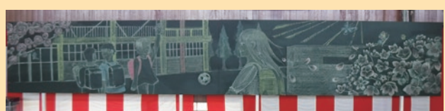
▲②伊奈東小学校の黒板アート

①：2つの黒板を合わせると、お互いの小学校の児童が、手を取り合うコンセプトが生まれるように制作されました。②：2つの黒板を合わせると、両校の児童が仲良く登校する描写が生まれるように制作されました。