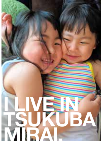
暑くなってきても、ベタベタくっつく仲よし姉妹♡