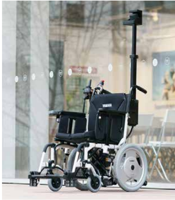
実証実験に使用する自動運転車いす

介護福祉施設において、歩行が困難な高齢者は車いすで移動していますが、その際、施設職員などの介助が必要となります。この自動運転車いすを導