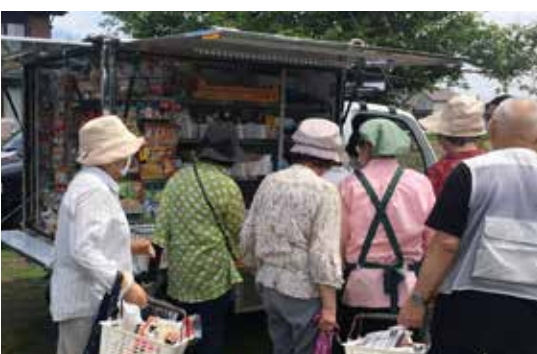
多くの皆さんでにぎわう移動スーパー