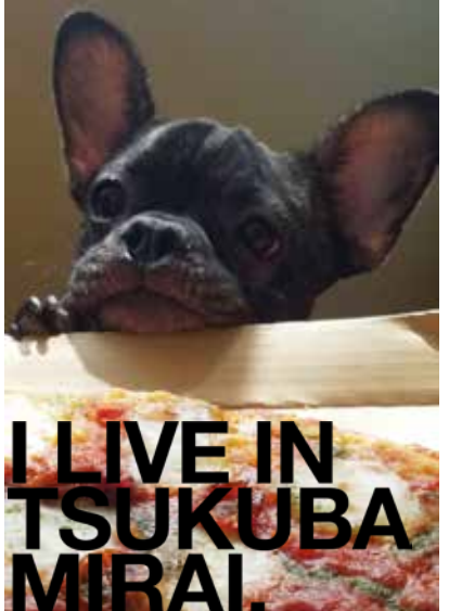
New Dog Food!?