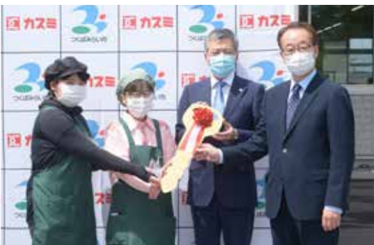
伊奈庁舎で実施した出発式

◎移動スーパーの時刻表は、広報6月号に掲載しているほか、市ホームページでもご覧になれます。