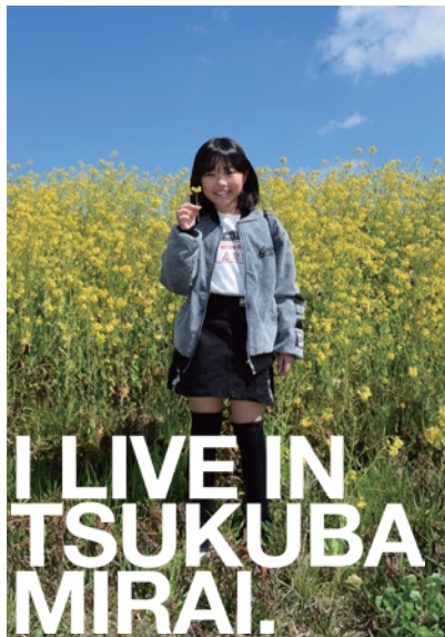
川縁の菜の花...春の訪れを満喫