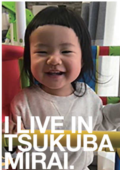
おうちでも元気いっぱい☆