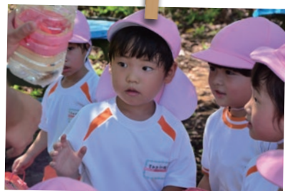
自然がたくさんあり、虫取りも楽しめます