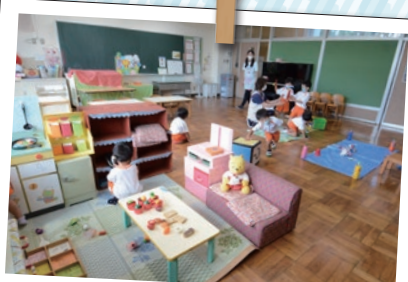
かつての教室はかわいらしいおもちゃでいっぱい