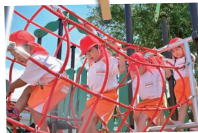
新しくなった遊具に園児たちも夢中