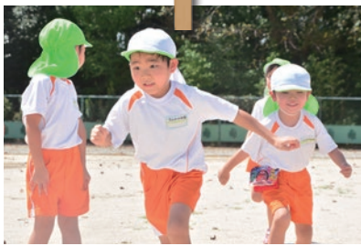
広がった園庭でリレーの練習をする園児たち