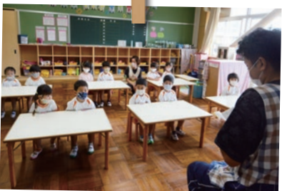
思い出の教室も保育室に生まれ変わりました