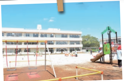
新しい園舎に子どもたちの声が響きます