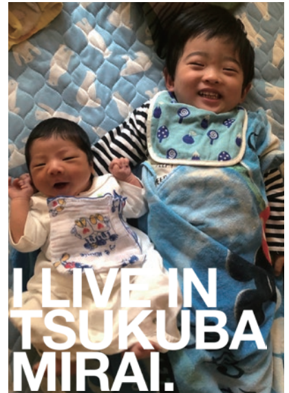
大好きなメーさんまであと少し