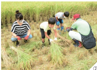
1: 鎌で稲を刈り取る参加者 2: 刈り取った稲は稲わらで縛ってひとまとめに