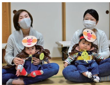
手作りのお面やマント、ベルトを身に付けてうれしそうなお子もたちとママ