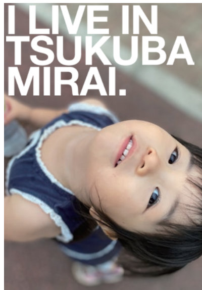
まだまだあつーい！！！！