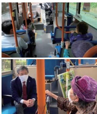
車内で利用者の声を聴く小田川市長

この期間中には、利用状況の把握や、市民の皆さんの声を直に聴かせていただくため、小田川市長もみらい号に乗