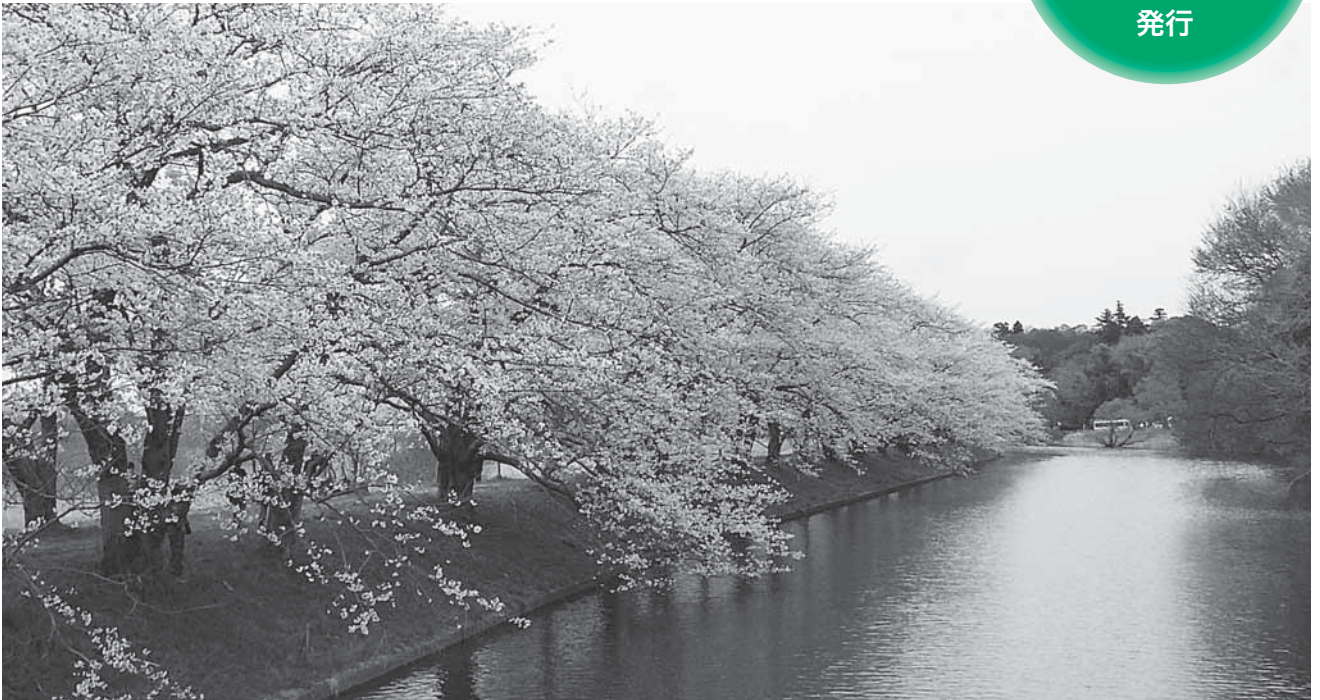
福岡堰のさくら並木