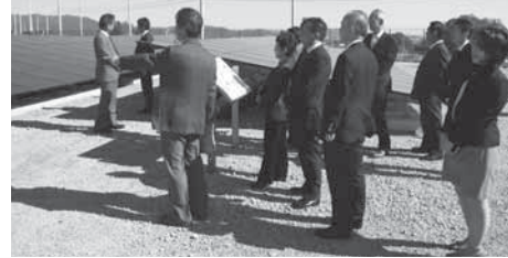
「おおた太陽光発電所」を視察