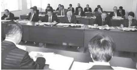
上田市議会委員会室での研修

平成 25 年 11 月 7 日（木）、8 日（金）に長野県上田市、群馬県太田市において、視察研修を行いました。上田市では、「議会運営と議会改革について」と題し、上田市議会における議会運営の状況や議会改革の取り組みなどについての説明を受けました。太田市では、「メガソーラー事業について」と題し、メガソーラー事業の取り組みに至った背景、取り組みの内容、今後の展開などについての説明を受けました。