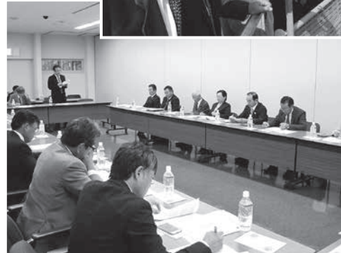
桐生市で小学校統廃合を研修