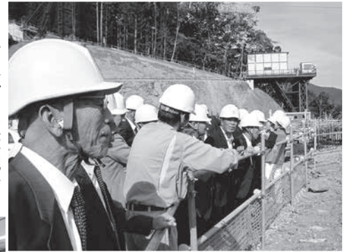
八ツ場ダム工事現場を視察

研修期間 平成 27 年 9 月 30 日・10 月 1 日 研修場所 群馬県吾妻郡長野原町及び桐生市 研修内容 『八ツ場ダムの治水と利水の役割について』・『小学校の統廃合について』 研修人員 16 人