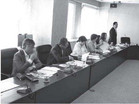
守谷市で議会広報紙を研修

研修期間 平成 27 年 7 月 10 日 研修場所 守谷市 研修内容 『議会広報紙に関する調査』 研修人員 6 人