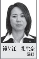
鐘ヶ江 礼生奈 議員