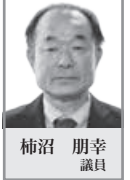
柿沼 朋幸 議員