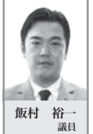
飯村 裕一 議員