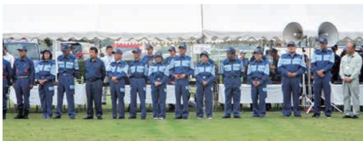
第58回 鬼怒・小貝水防連合体水防訓練が 7月2日(日)に行われました。

※日程等については変更になる場合があります。なお、会期日程は、議会運営委員会（通常は開会日の7日前に開催）で協議され、定例会初日の本会議で決定されますので、事前に議会事務局までお問い合わせ下さい。