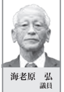
海老原 弘 議員