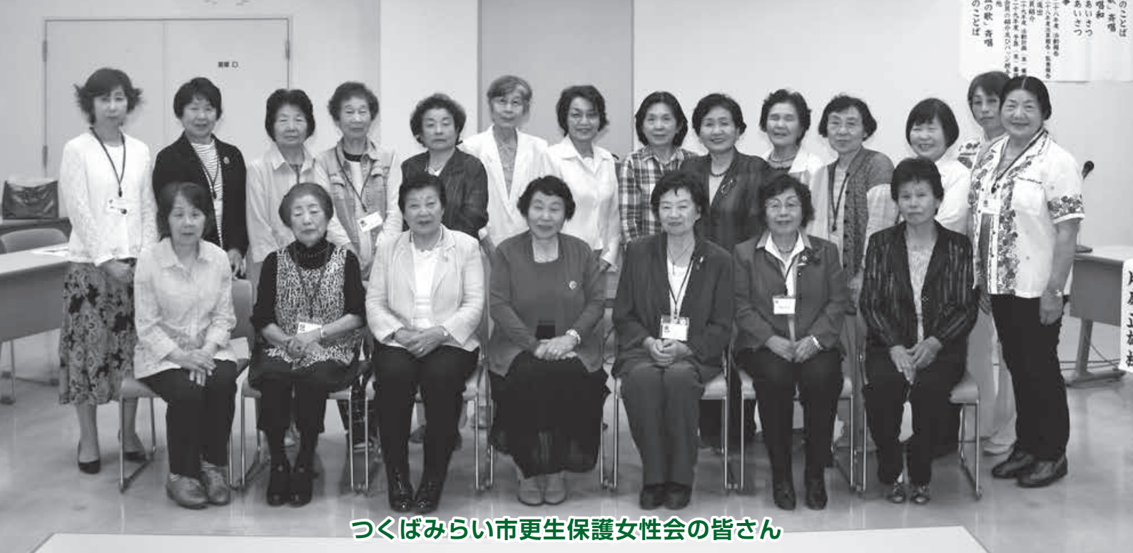
つくばみらい市更生保護女性会の皆さん