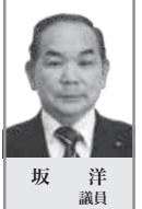
坂 洋 議員