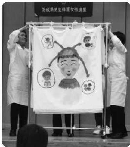
カーテンシアターの風景