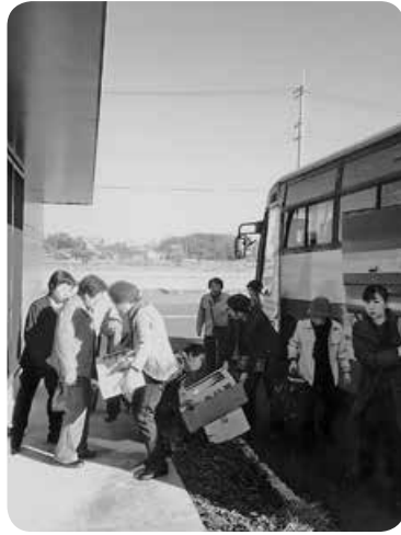
バスに支援物資を搬入

お米や白菜、じゃがいも等の野菜、こどもたちの衣類などを地域の農家の方やみなさんで集めて、市のバスにいっぱい積んで持っていきます。