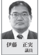
伊藤 正実 議員