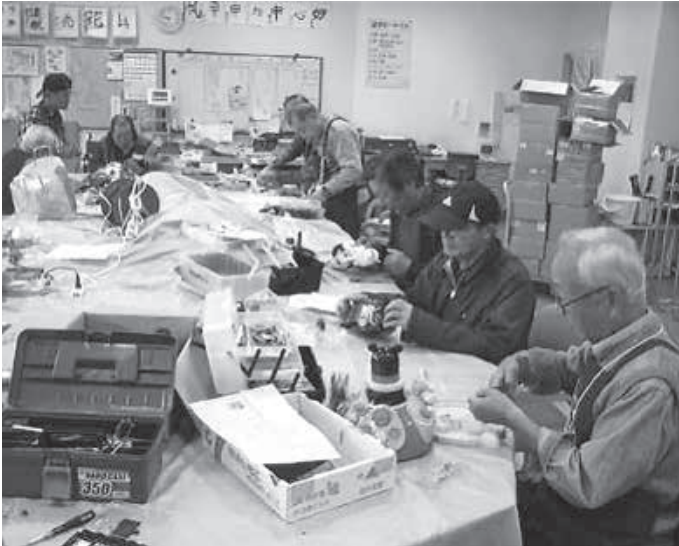
おもちゃ病院ピノキオ

目標は、調理の際にメニューのレシピに沿わずに、味や作り方を自分たちで工夫して作ってあげればと思います。また、メンバーも高齢化