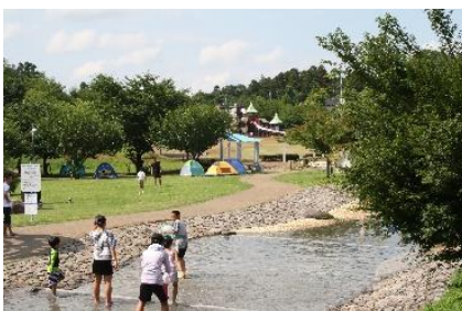
▲福岡堰さくら公園-1