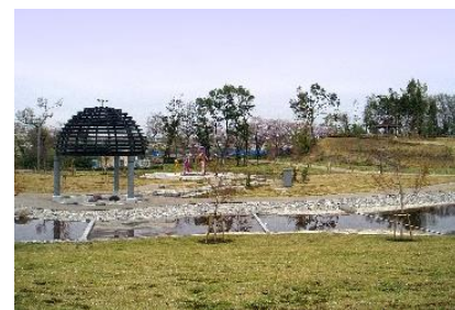
▲福岡堰さくら公園-2

※住区基幹公園：住区基幹公園は（街区公園・近隣公園・地区公園）として分類され、主として居住する者の利用に供することを目的とする公園。