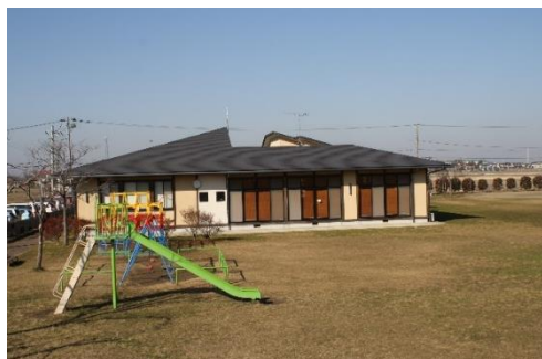
▲谷井田コミュニティセンター