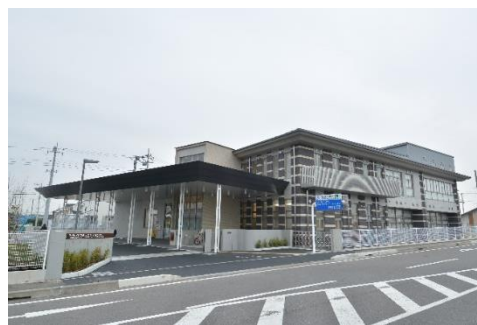
▲みらい平コミュニティセンター