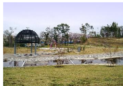
▲福岡堰さくら公園-2