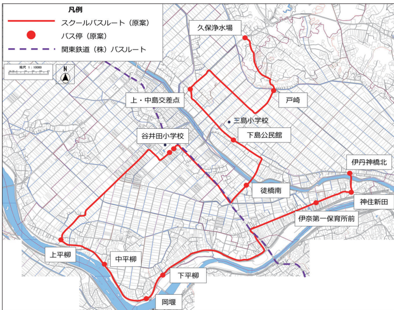
谷井田小学校・三島小学校のスクールバスルートとバス停留所の原案