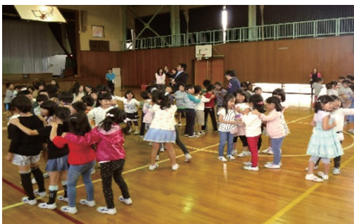
じゃんけん列車を楽しむ児童たち

当日は、両校の1・2年生と、3・6年生に分かれて「交通安全教室」が行われました。常総警察署の署員が講師となり、交通事故についての講話や、事故に遭わないための対処法を学ぶ動画を視聴するなど、交通ルールについて学びました。最後に全員で「じゃんけん列車」を実施。ルールを守りながら、板橋小・東小の児童全員が一緒になって楽しみながら交流しました。 今後も統合校の子どもたちが、より仲良くなれるように、交流事業を継続して実施していきます。