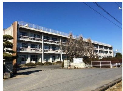
改修前の伊奈中学校校舎