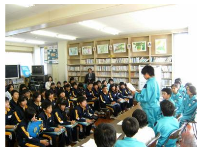
中学生との交流事業