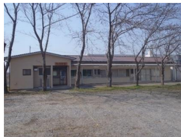
教育支援センター なのはな