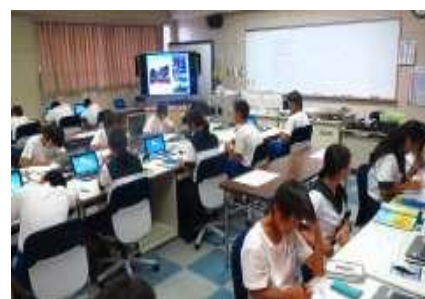
パソコン教室の様子