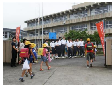
小中あいさつ運動の様子