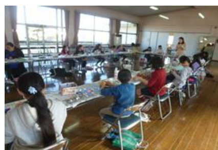
わくわくチャレンジ講座の様子