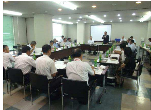
つくばみらい市歩道整備基本計画策定委員会 委員名簿