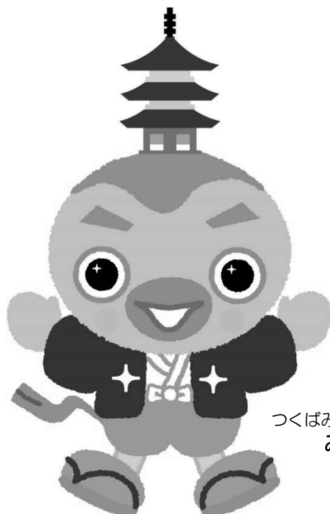
つくばみらい市公式キャラクター みらいりんぞう

男女を問わず、働きながら子育てに向き合えるよう、職場全体の長時間労働の是正、本人の希望に応じた育児休業や短時間勤務を取得しやすい環境づくりや職場復帰の支援等、引き続きワーク・ライフ・バランスが図られるような雇用環境の整備に努めます。